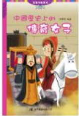
中國歷史上的傳奇女子