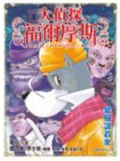
大偵探福爾摩斯 40 暴風謀殺案