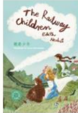
The Railway Children 鐵路少年