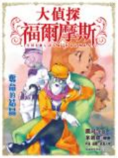
大偵探福爾摩斯 16 奪命的結晶