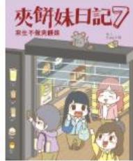
夾餅妹日記 7 來生不 做夾餅妹